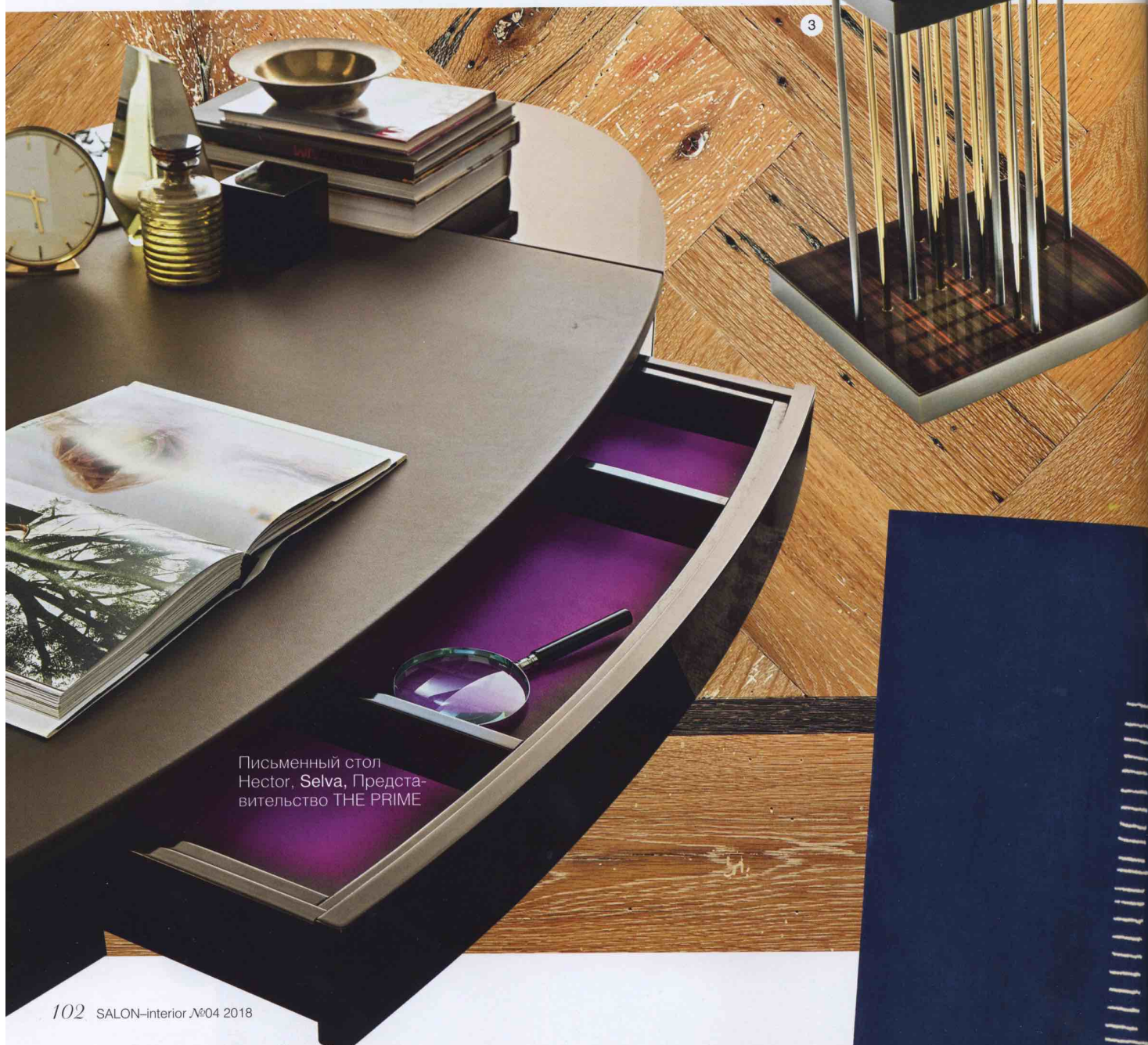
Письменный стол Нестор, Selva, Предста- вительство THE PRIME